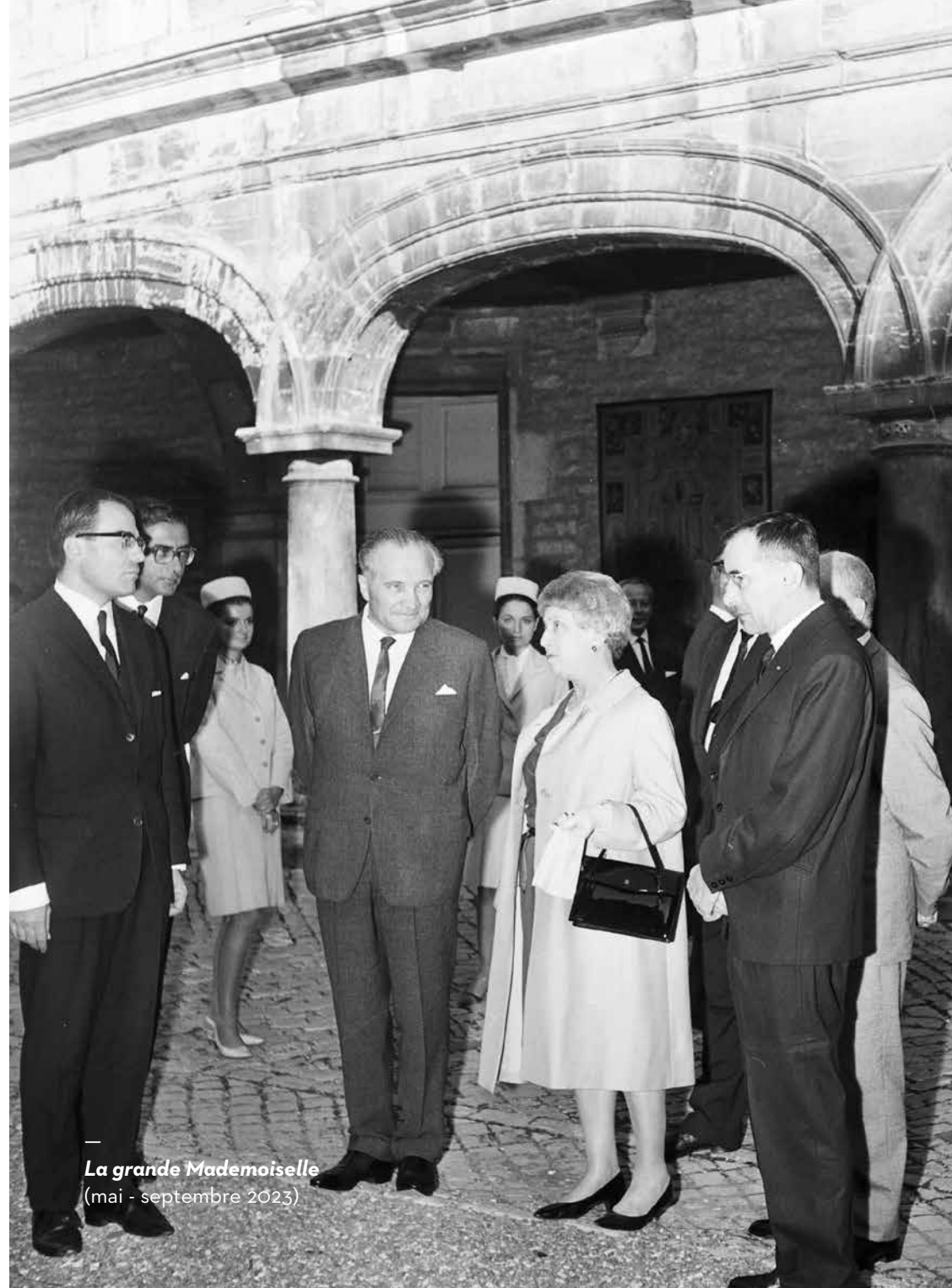
La grande Mademoiselle (mai - septembre 2023)

🕒 Durée 45 minutes environ ou 1h15 avec le musée du Temps