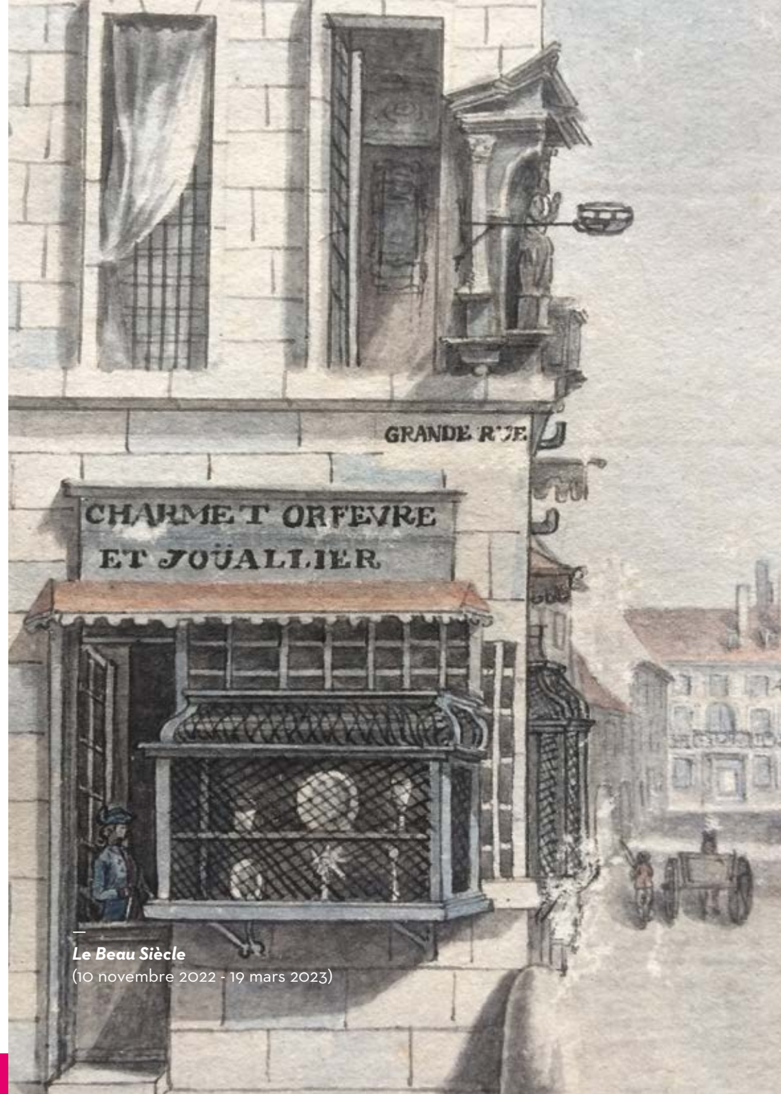
Le Beau Siècle

🕒 Durée 1h environ ou 1h30 avec le musée du Temps