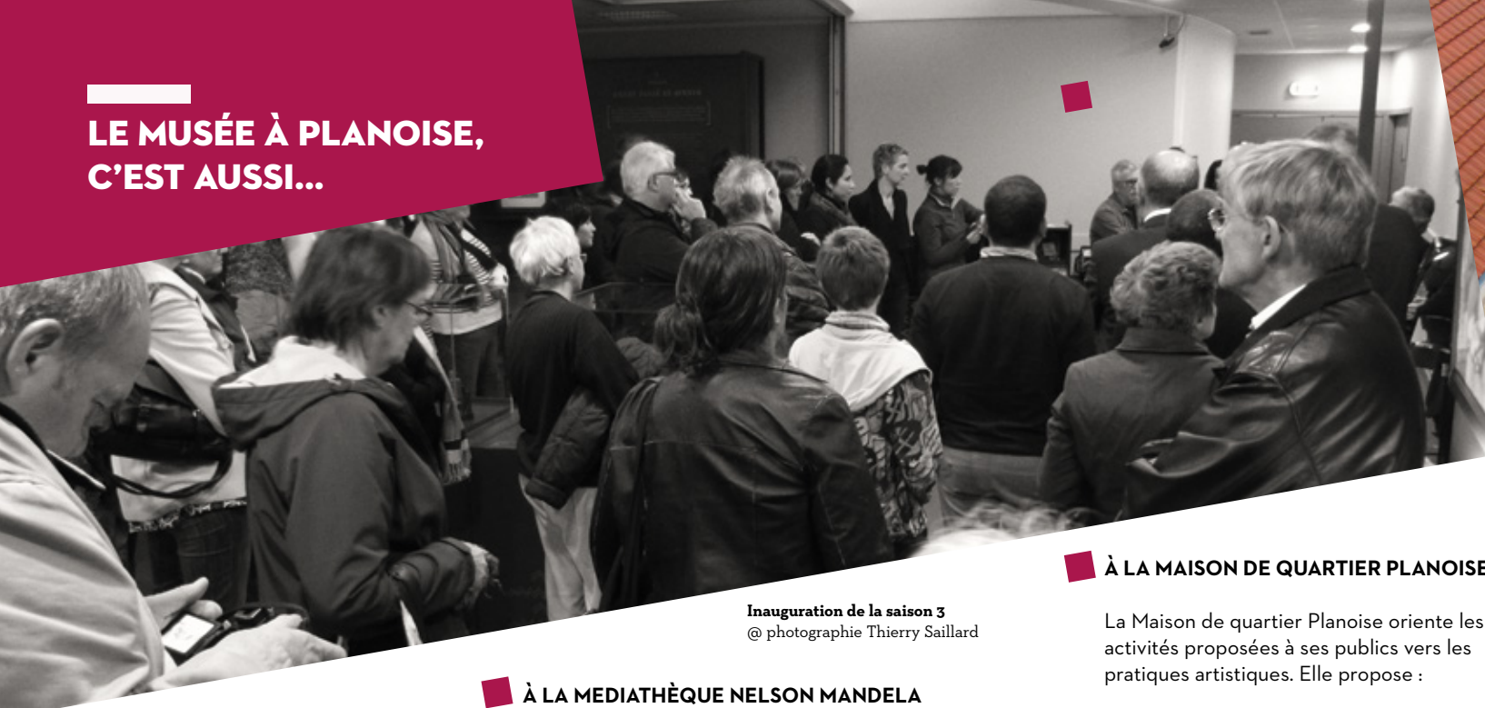
Inauguration de la saison 3