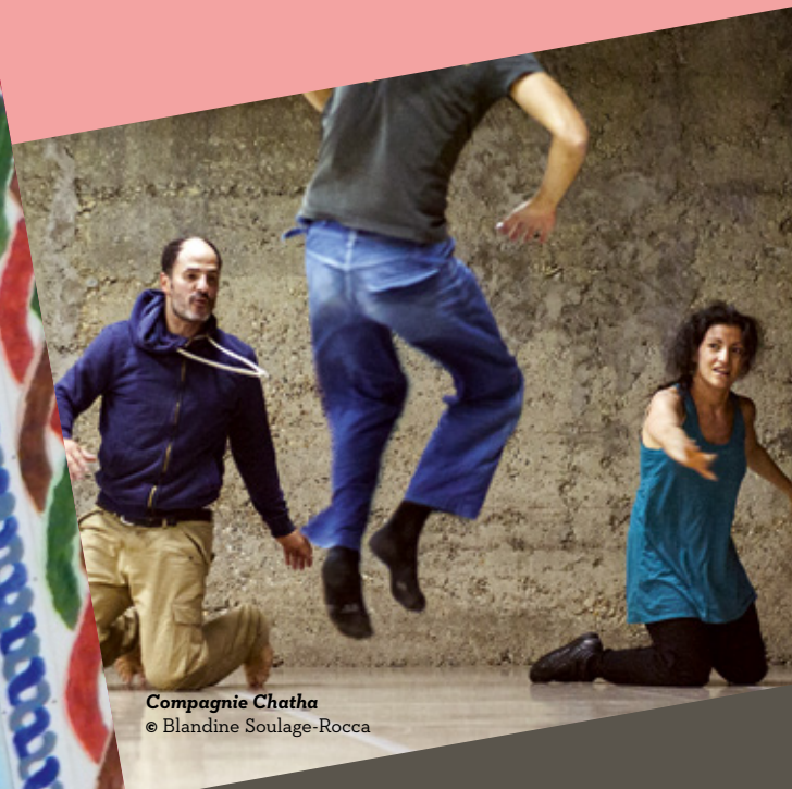
Compagnie Chatha

TOUS LES GROUPES ET LES STRUCTURES AYANT PARTICIPÉ À L'OPÉRATION DU MUSÉE S'INVITE À PLANOISE SERONT INVITÉS PAR LA COMPAGNIE CHATHA À PARTICIPER À LA CRÉATION DU SPECTACLE DE CLÔTURE .