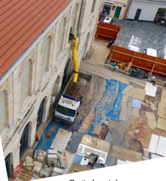
Chantier du musée des Beaux-Arts & d'Archéologie

Les Archives départementales proposent de découvrir la maquette du quartier de Planoise mais aussi une sélection de documents de leurs collections en lien avec la saison 4 Mets et délices . Elles accueilleront la restitution des ateliers menés avec les enfants des associations PARI et Des Racines et des feuilles au premier semestre 2017.