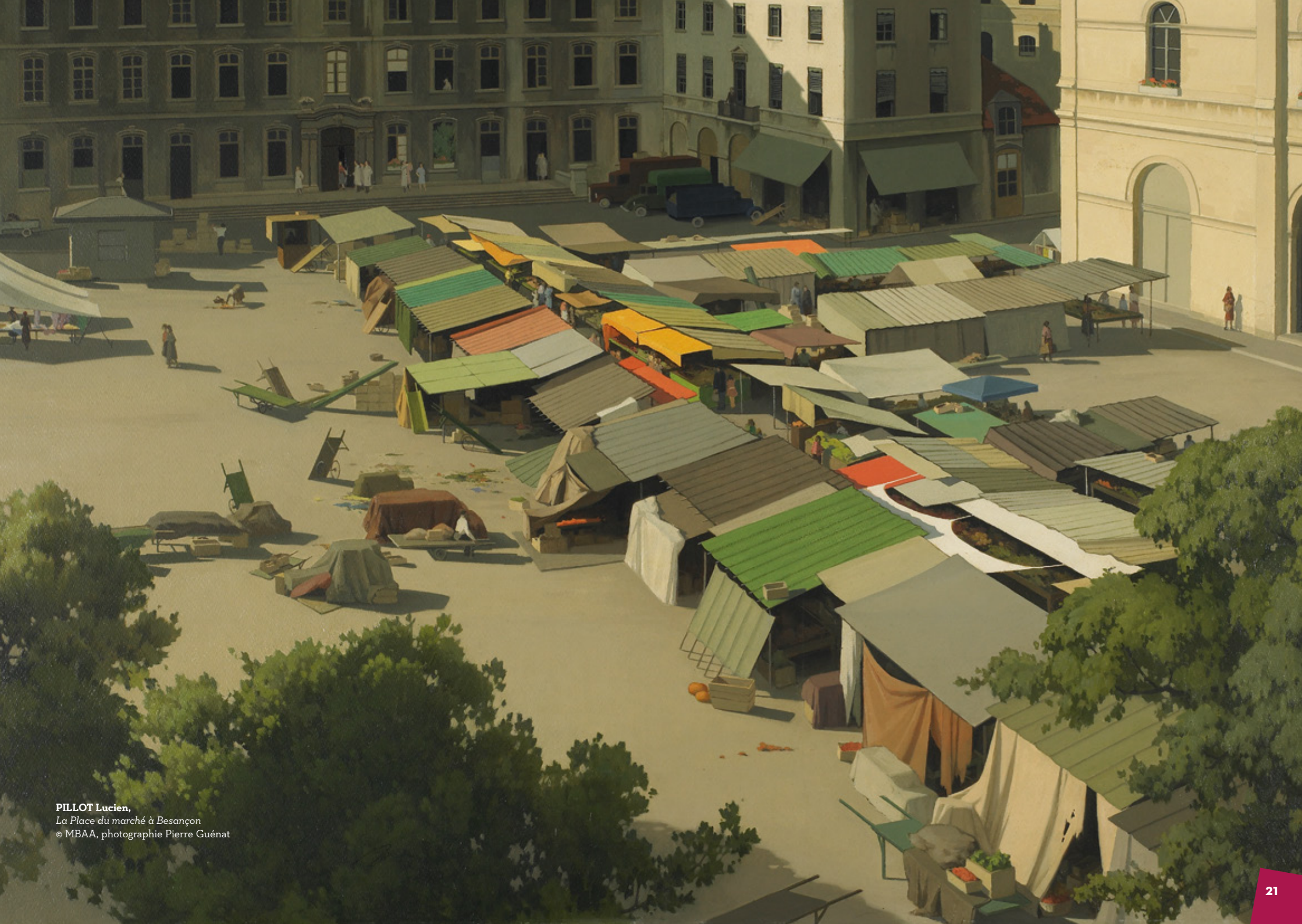
PILLOT Lucien, La Place du marché à Besançon