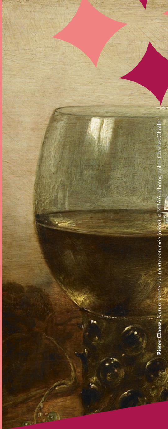
Pieter Claesz, Nature morte à la tourie entamée (détail) © MBAA, photographie Charles Choffet

commissaire scientifique : Lisa Diop / programmation culturelle : Marielle Ponchon / coordination de la publication : Anne-Lise Coudert / conception graphique : Thierry Saillard / impression : imprimerie municipale / septembre 2016