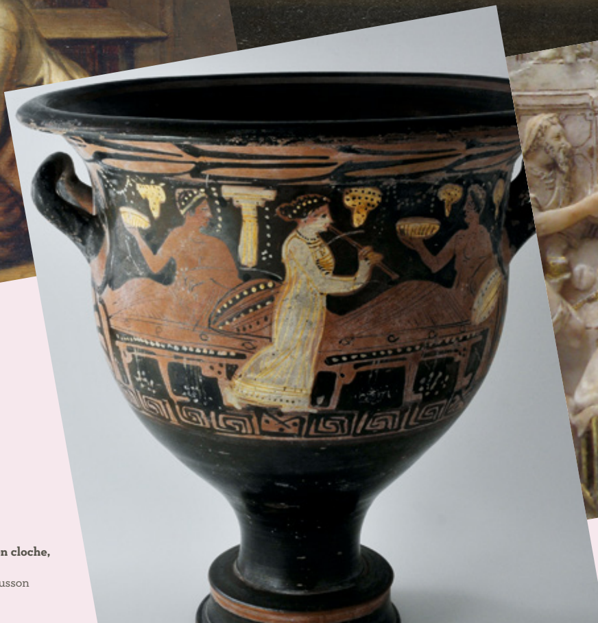
Scène de banquet, cratère en cloche