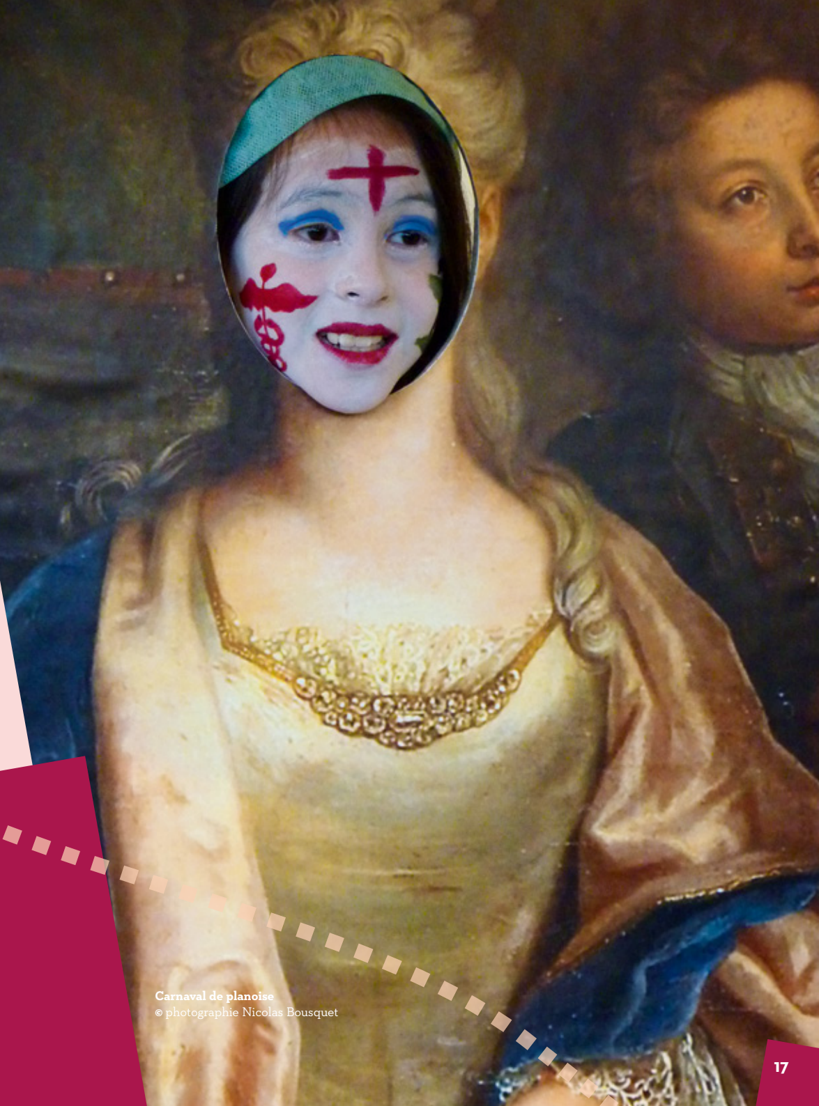
Carnaval de planoise

Renseignements : Stéphanie Rodrigues, coordinatrice Francas Planoise / Centre de loisirs Rosa Parks : 03 81 51 23 25, francas.idf@orange.fr