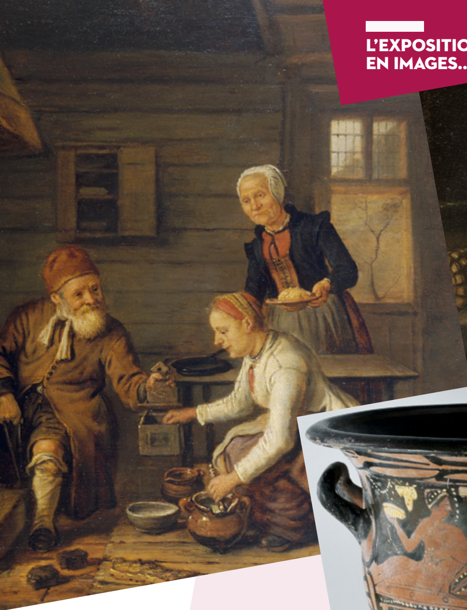
Yan Vickers, Intérieur de cuisine , © MBAA de Besançon, photographie Charles Choffet