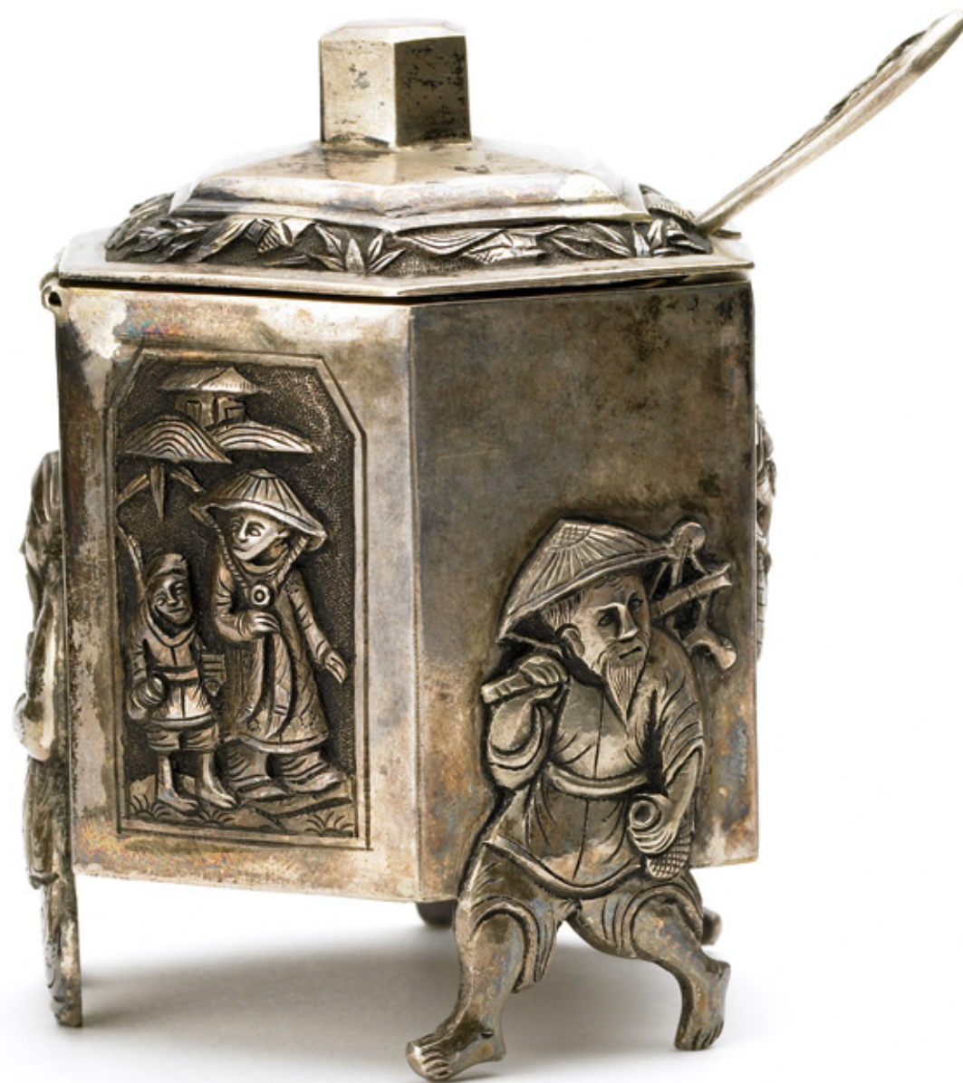
Moutardier, Hanoi @ coll. du MBAA, photographie Pierre Guénat

CRR : Conservatoire à Rayonnement Régional