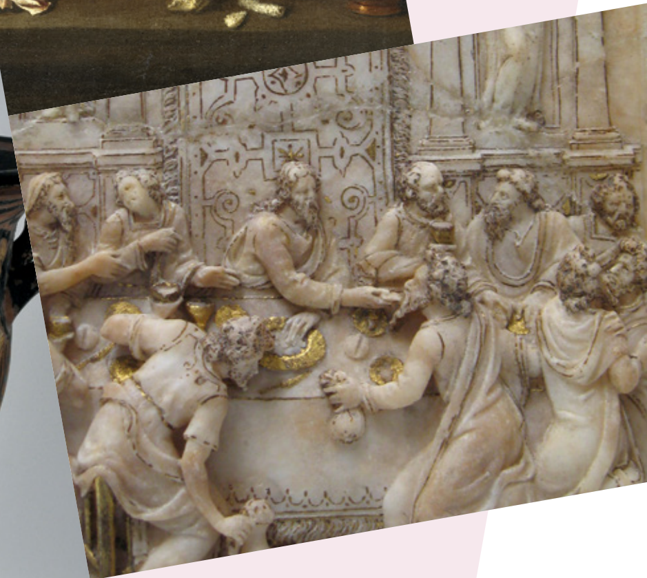
Ànonyme, La Cène , © MBAA de Besançon, photographie Jean-Louis Dousson