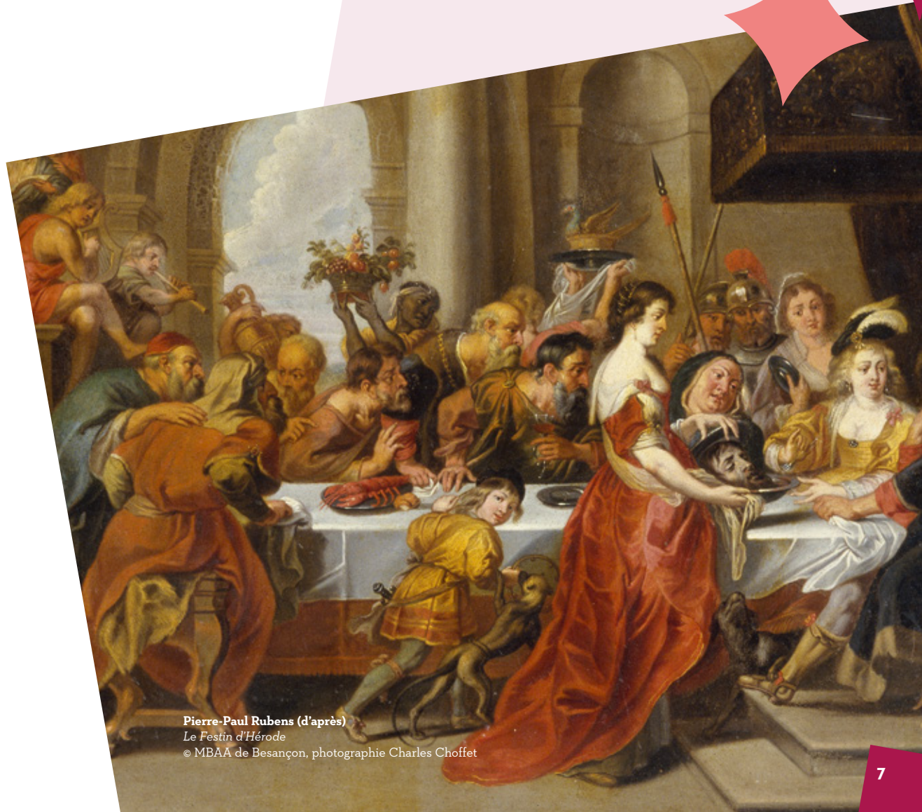
Pierre-Paul Rubens (d'après)