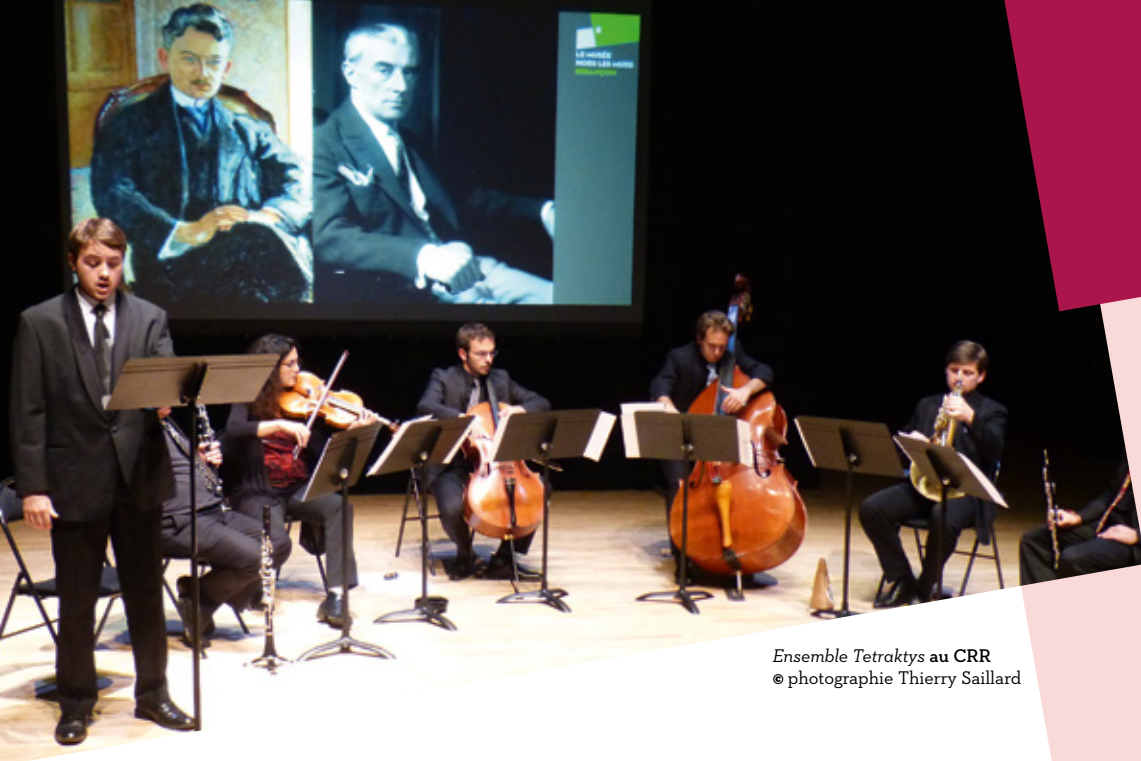
Ensemble Tetraktys au CRR