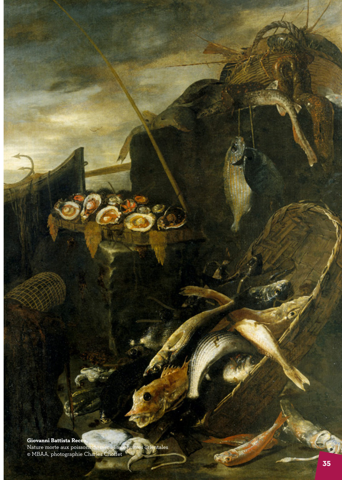
Giovanni Battista Recco, Nature morte aux poissons de mer et aux huîtres orientales

Les expositions et actions culturelles hors les murs du musée sont entièrement gratuites, à l'exception des ateliers, films et spectacles proposés à l'Espace/Les 2 Scènes.