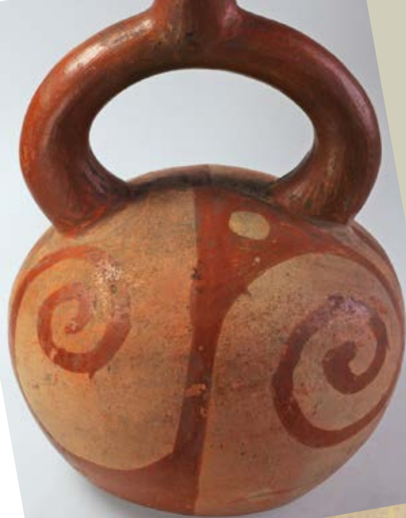
Vase à anse goulot en étrier, terre cuite, époque précolombienne