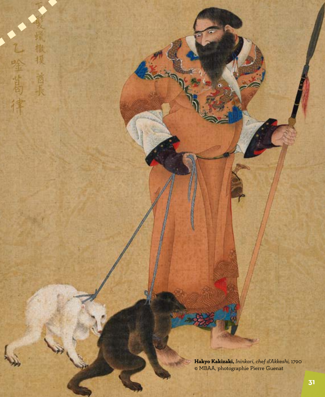
Hakyo Kakizaki, Ininkari, chef d'Akkeshi, 1790

Les expositions et actions culturelles hors les murs du musée sont entièrement gratuites, à l'exception des ateliers, films et spectacles proposés à l'Espace/Les 2 Scènes.