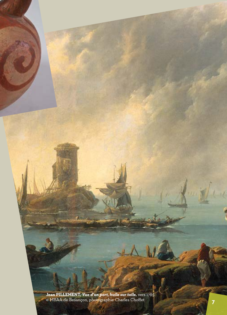
Jean PILLEMENT, Vue d'un port, huile sur toile , vers 1785