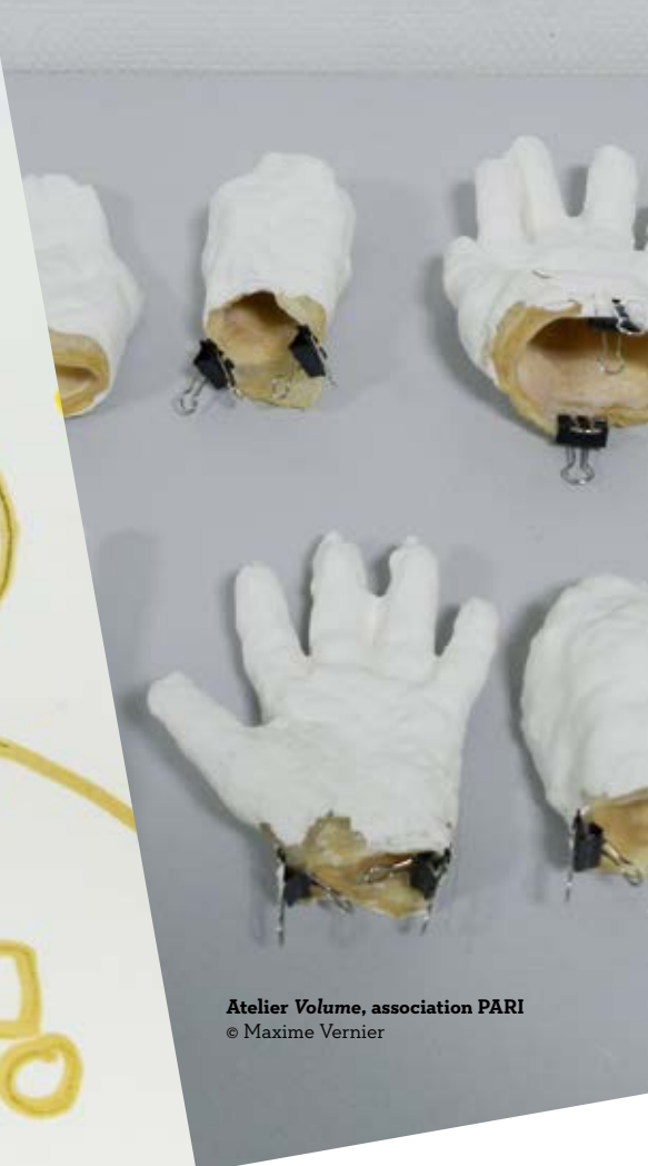
Atelier Volume, association PARI