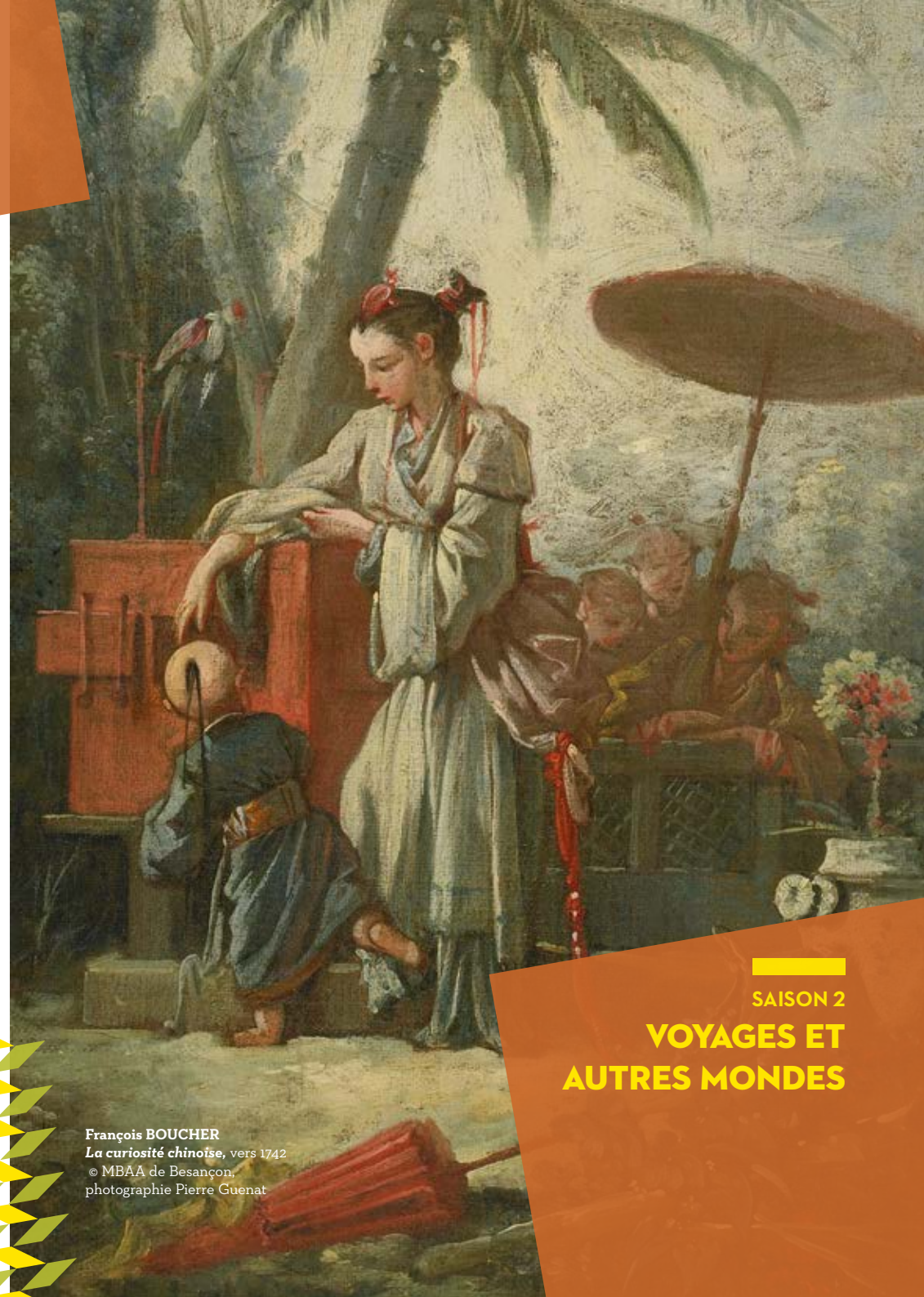
François BOUCHER La curiosité chinoise , vers 1742