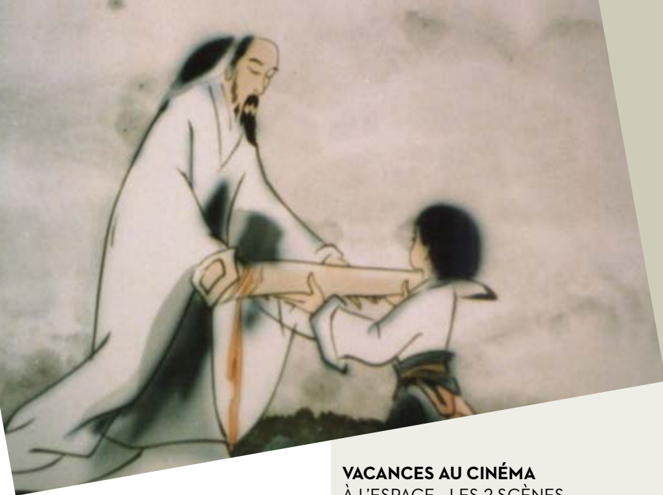
Peinture au lavis extraite d' Impression de montagne et d'eau , quatre films de Hu Jinqing, Zhou Kequin, Te Wei