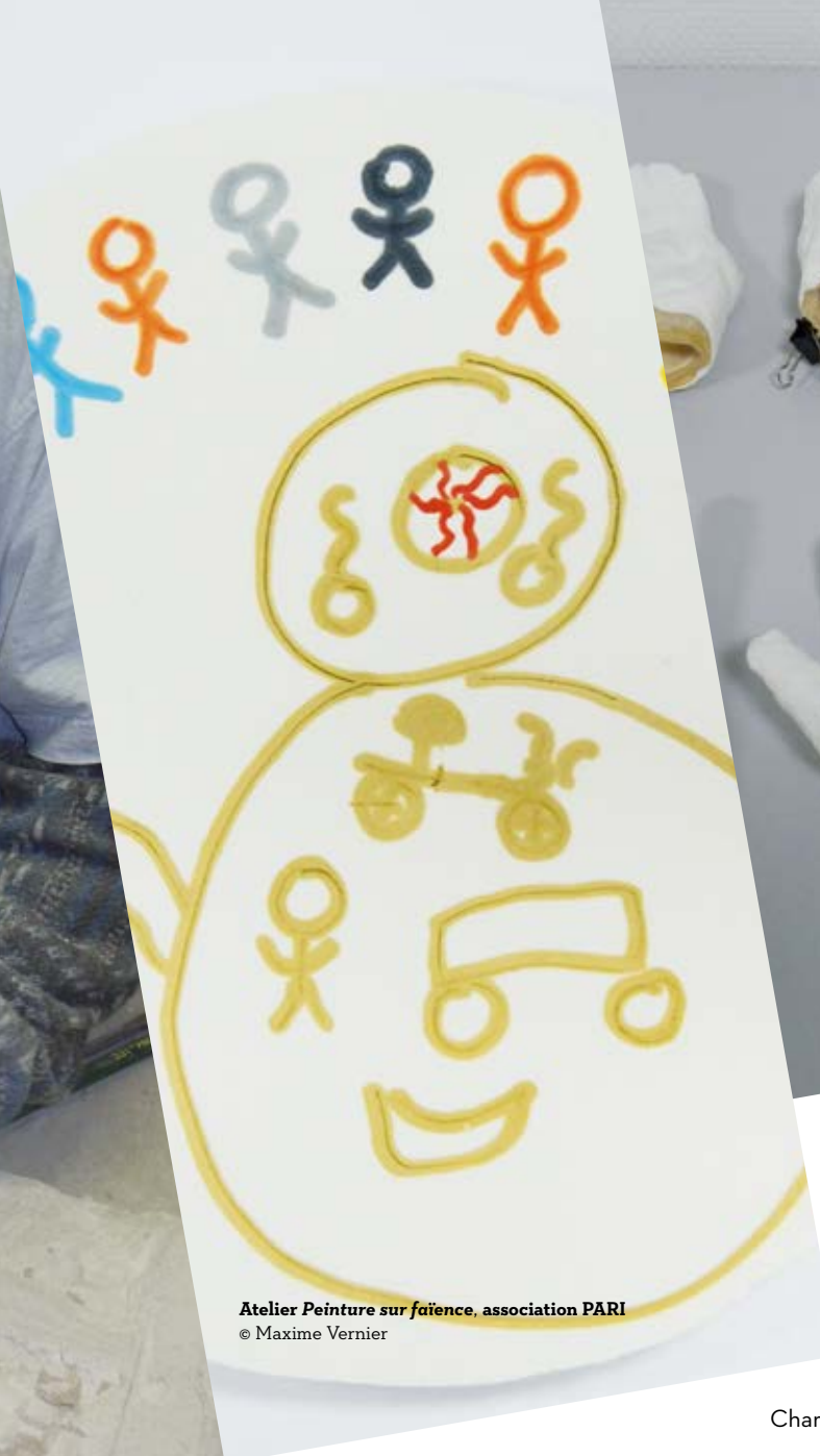
Atelier Peinture sur faïence, association PARI

Atelier L'Autre est le Même, CCAS, MDQ et collège Diderot