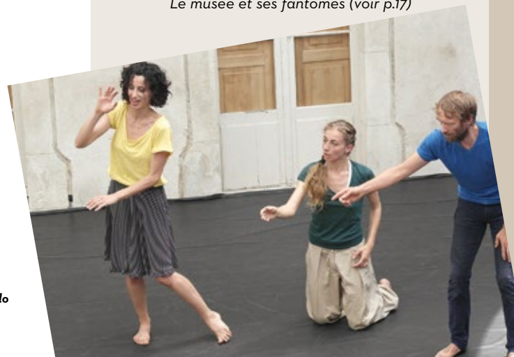
16. Insalata al venelo

- A 16h30 : visite guidée La symbolique du temps dans les collections du musée , suivie par une présentation de l'exposition Les Soeurs Brown .