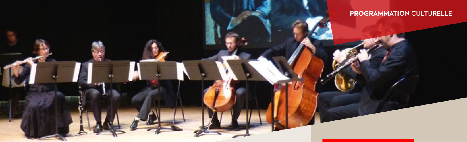
15. Ensemble Tetraktys, Conservatoire à rayonnement régional, 14 novembre 2014