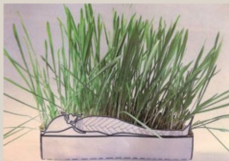
23. Atelier Osiris végétant © MBAA