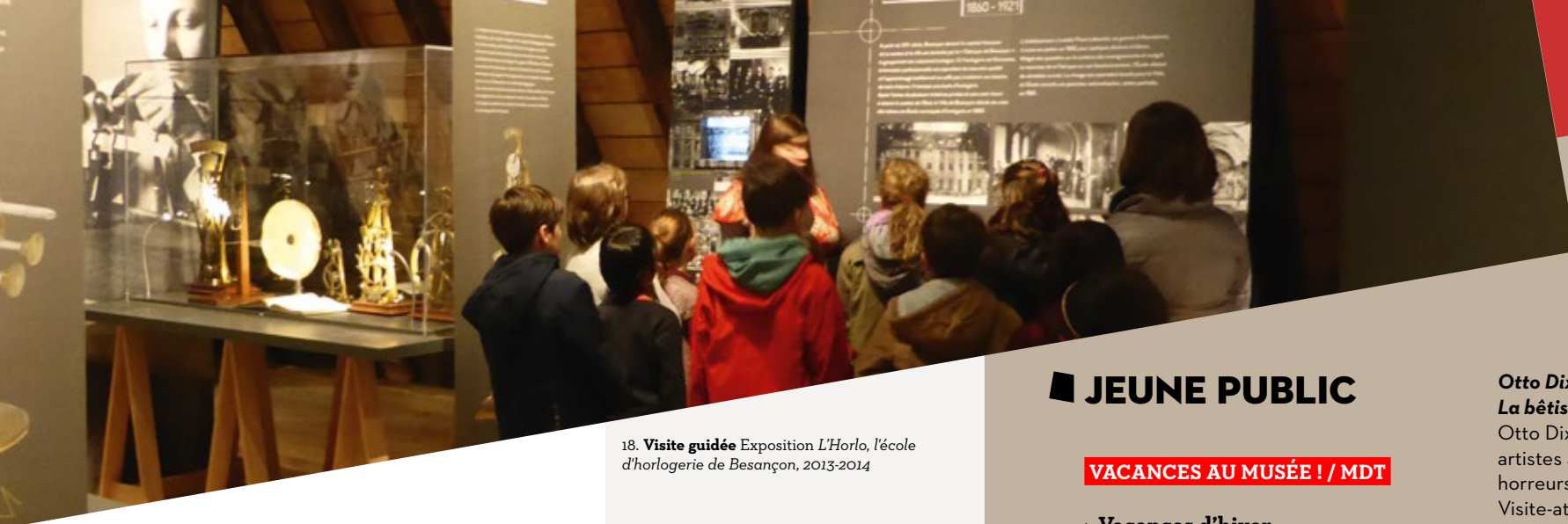
18. Visite guidée Exposition L'Horlo, l'école d'horlogerie de Besançon, 2013-2014