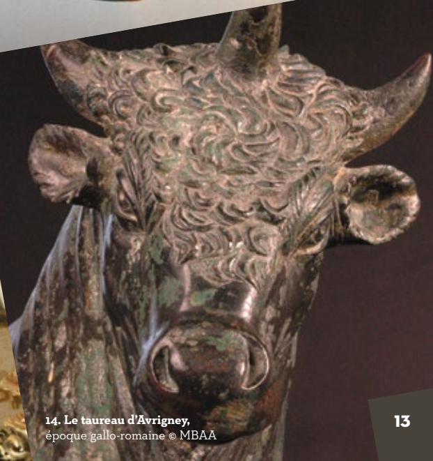
14. Le taureau d'Avrigny, époque gallo-romaine