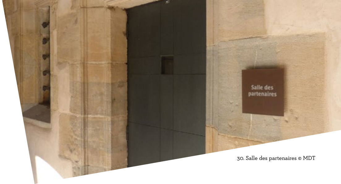
30. Salle des partenaires

Les partenariats prolongent l'engagement économique, social et environnemental du groupe EDF dans la société. Portant leurs valeurs, ils constituent un moyen de consolider les relations de proximité avec tous les publics, les associations et les collectivités territoriales notamment.