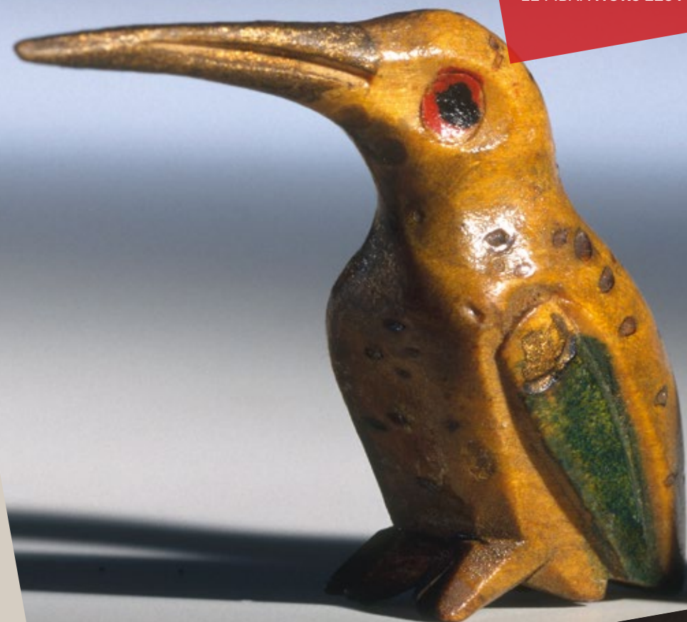
12. Colibri (huitzil), Mexique

Des ateliers, des parcours urbains, des conférences accompagneront cet événement.