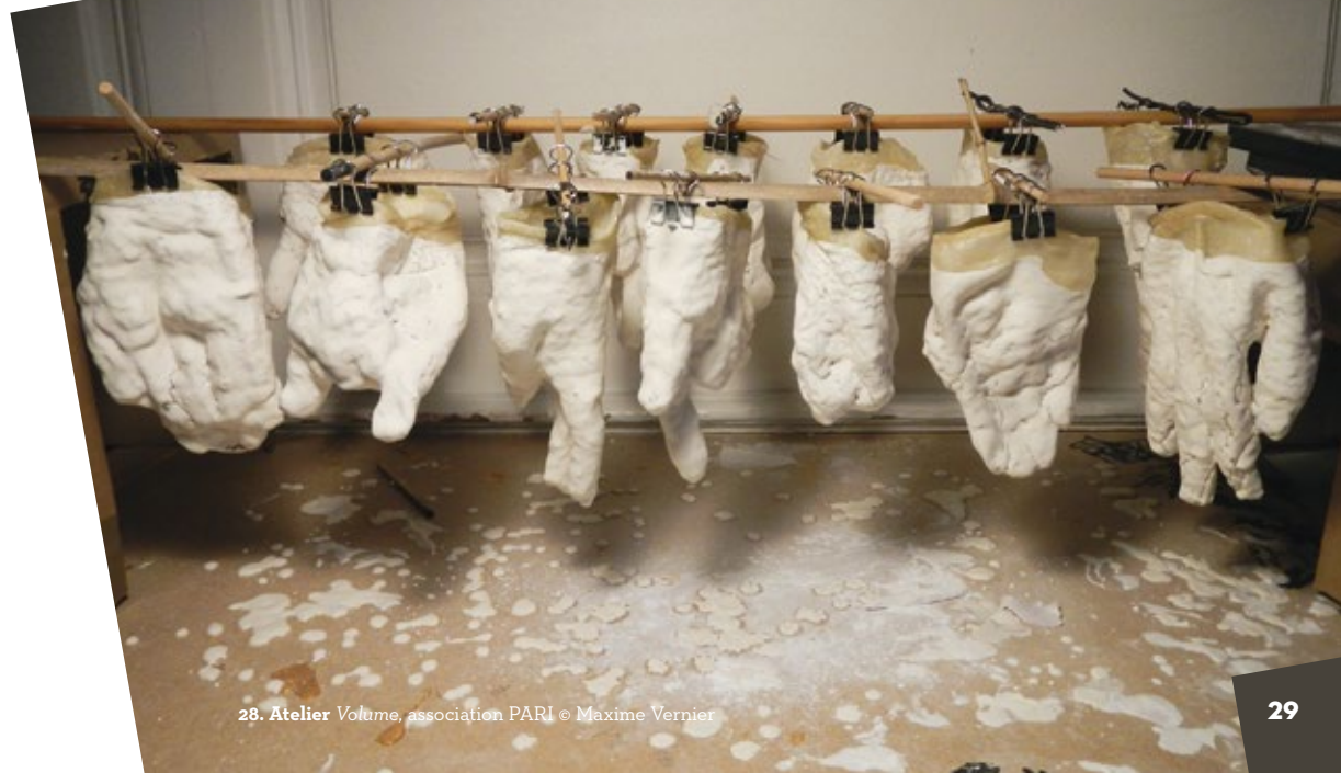
28. Atelier Volume , association PARI © Maxime Vernier