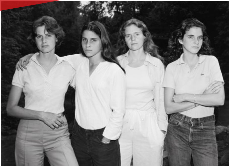
9. Nicholas Nixon, Brown Sisters 1975, collection Fondation Mapfre