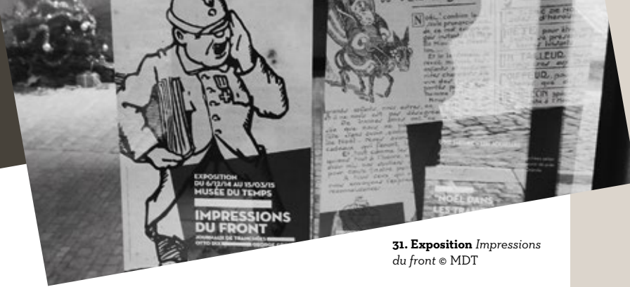
31. Exposition Impressions du front

A 16h30 : Visite guidée de l'exposition Impressions du front / MDT