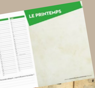
20. Calendrier, atelier Au fil des saisons © MDT, réalisation Thierry Saillard

> Les jeudis 30 avril et 7 mai 2015 à 14h30 Pour les 8/11 ans