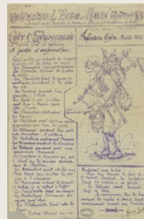
3. Journal de tranchées, L'Echo du ravin , n°8, 1915

Les cinquante eaux-fortes du portfolio Der Krieg (La Guerre) d'Otto Dix (1891-1969), publié en 1924 par le galeriste Karl Nierendorf, constituent quant à elles un exemple rare de témoignage artistique de la guerre.