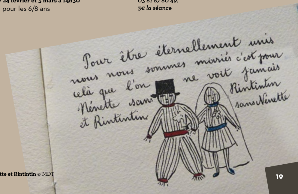
19. Nénette et Rintintin

Sur inscription à l'accueil du musée, ou par téléphone au 03 81 87 80 49, 3€ la séance