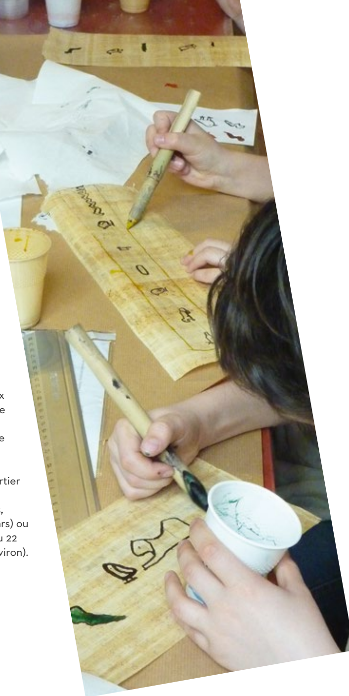
26. Atelier Hiéroglyphes, Centre de loisirs de Saône

Retrouvez le détail des ateliers proposés dans le programme du Musée s'invite à Planoise , saisons 1 et 2.