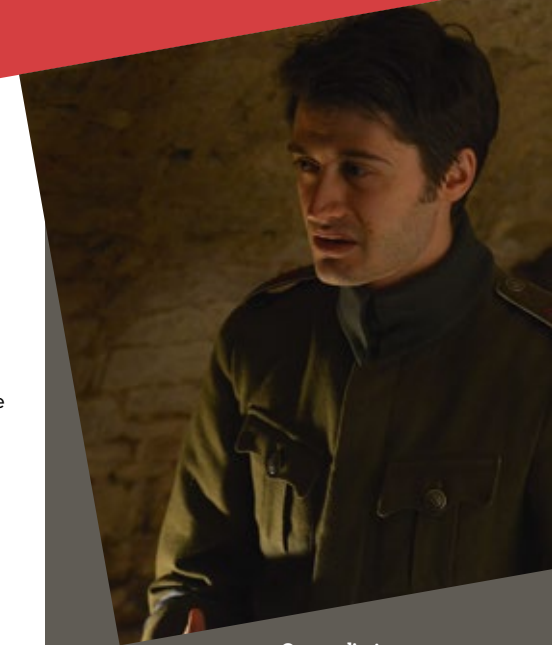
7. Orages d'acier, Compagnie Malanoche

8. Journal de tranchées, La Ligature, La faune du front, n°17, 20 mai 1917 © MDT