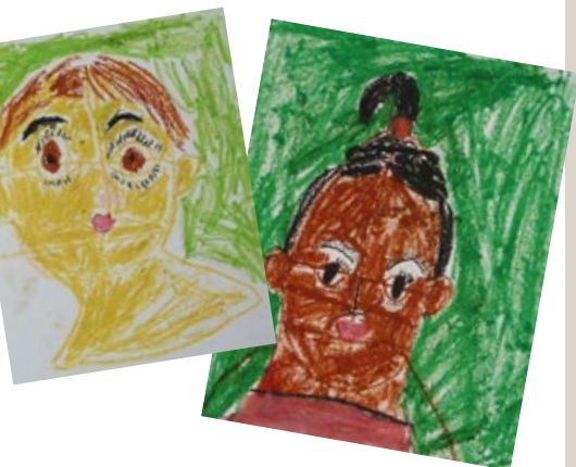
22. Atelier Portrait craie grasse , Centre Nelson Mandela, école Fourier, CE1 de M. Vovilier