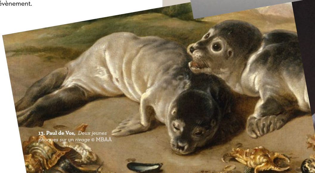
13. Paul de Vos, Deux jeunes phoques sur un rivage