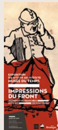
4. Affiche de l'exposition Impressions du front © MDT, réalisation Thierry Saillard