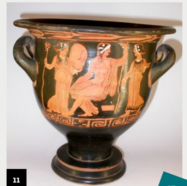
11. Cratère en cloche avec Bacchus , 1 er quart du IV ème siècle av. J.-C., Italie