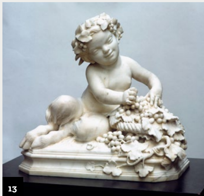
13. Camille DEMESMAY , Jeune faune , marbre blanc, 1858