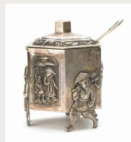
Moutardier, Hanoï