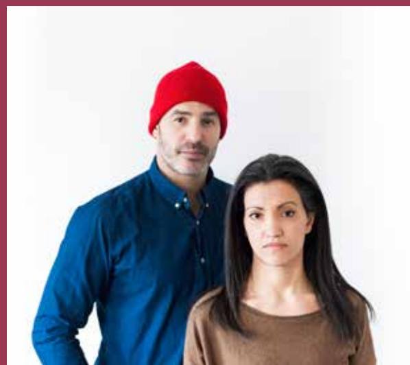
Compagnie Chatha