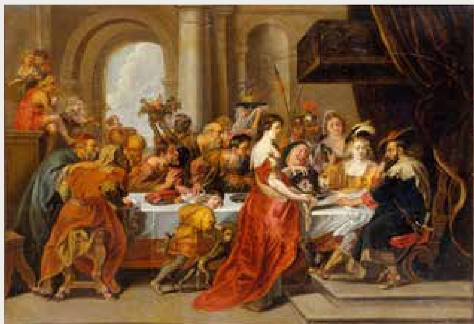
Pierre-Paul Rubens (d'après), Le Festin d'Hérode