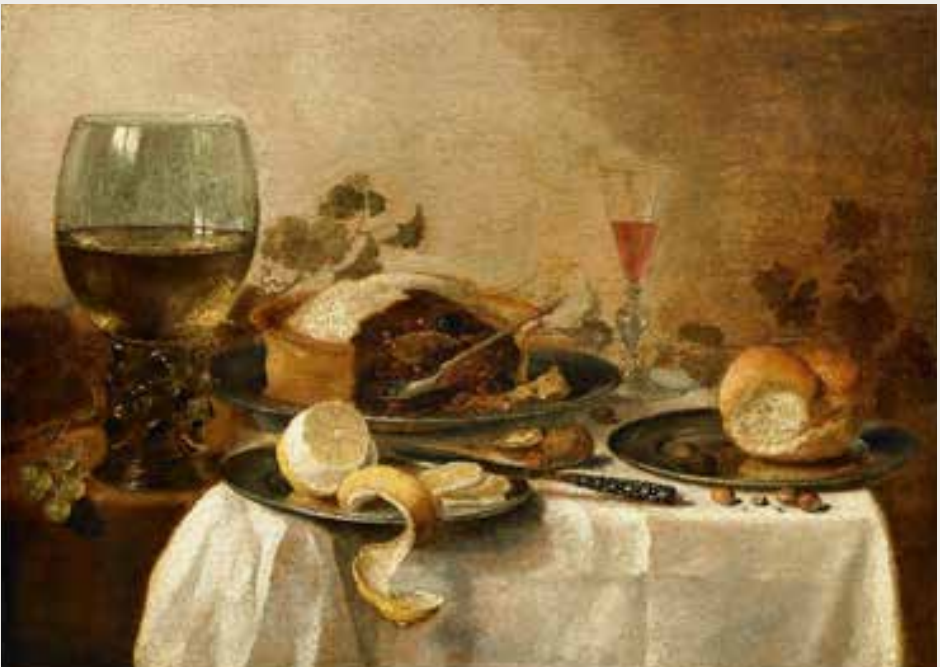
Pieter Claesz, Nature morte à la tourte entamée