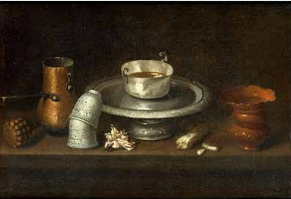
Juan de Zurbaran, Nature morte au bol de chocolat