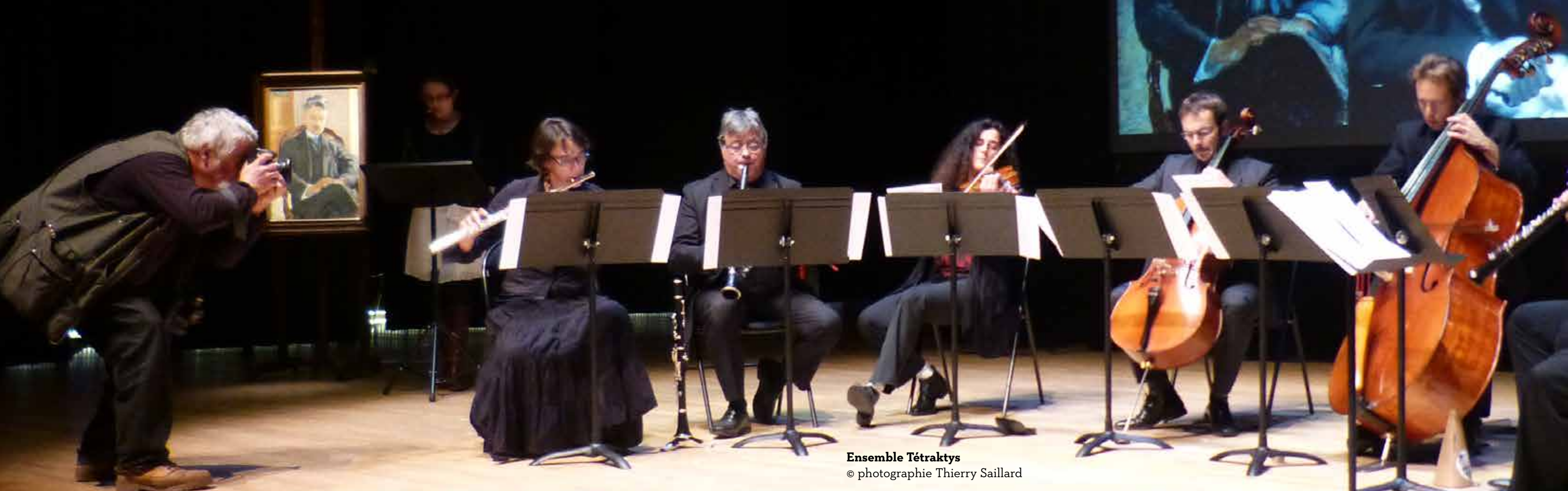
Ensemble Tétraktys