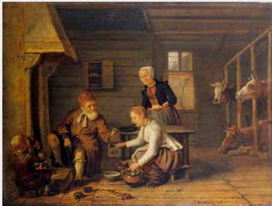
Jan Victors, Intérieur de cuisine