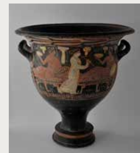
Scène de banquet, cratère en cloche