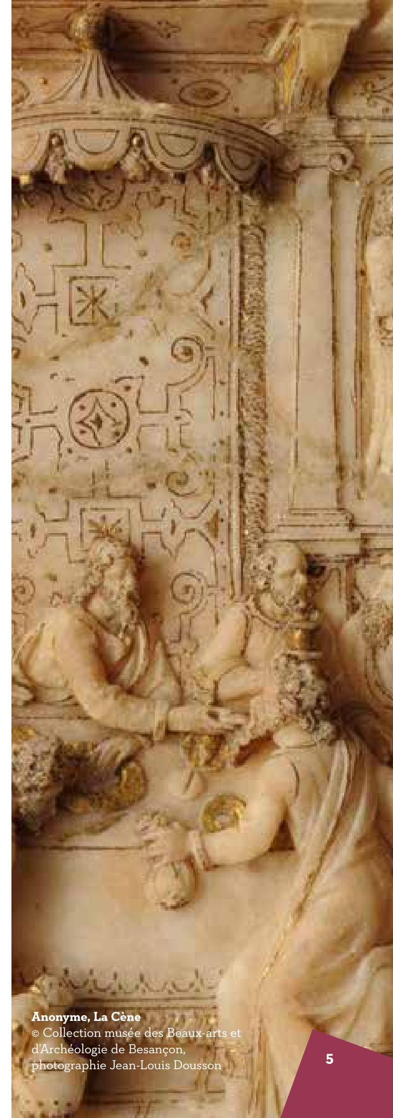
Anonyme, La Cène

Les traces matérielles, objets liés à l'alimentation conservés dans des collections ou issus de fouilles, mais aussi débris et restes trouvés dans des fosses « dépotoirs » par les archéologues, restent quant à elles des sources primordiales pour l'histoire du boire et du manger.