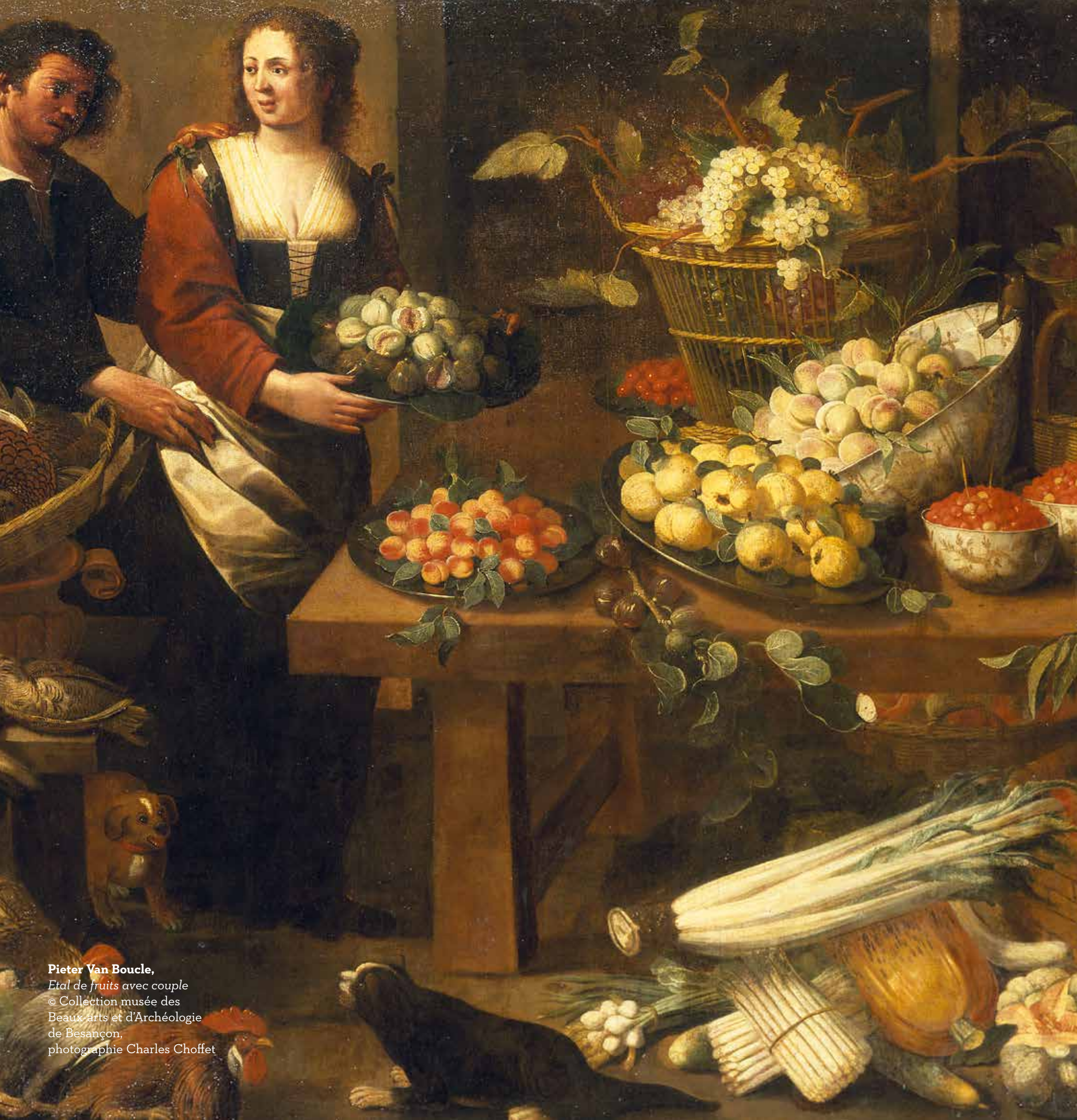
Pieter Van Boucle, Etal de fruits avec couple

SAISON 4 « METS ET DÉLICES » 7 OCTOBRE 2016 – 1 ER JUILLET 2017