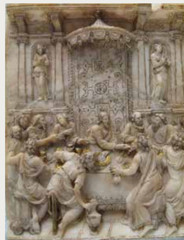
Anonyme, La Cène