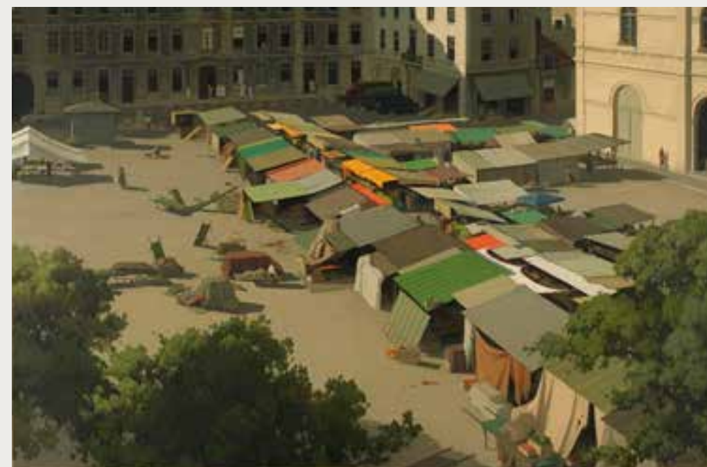
PILLOT Lucien, La Place du marché à Besançon