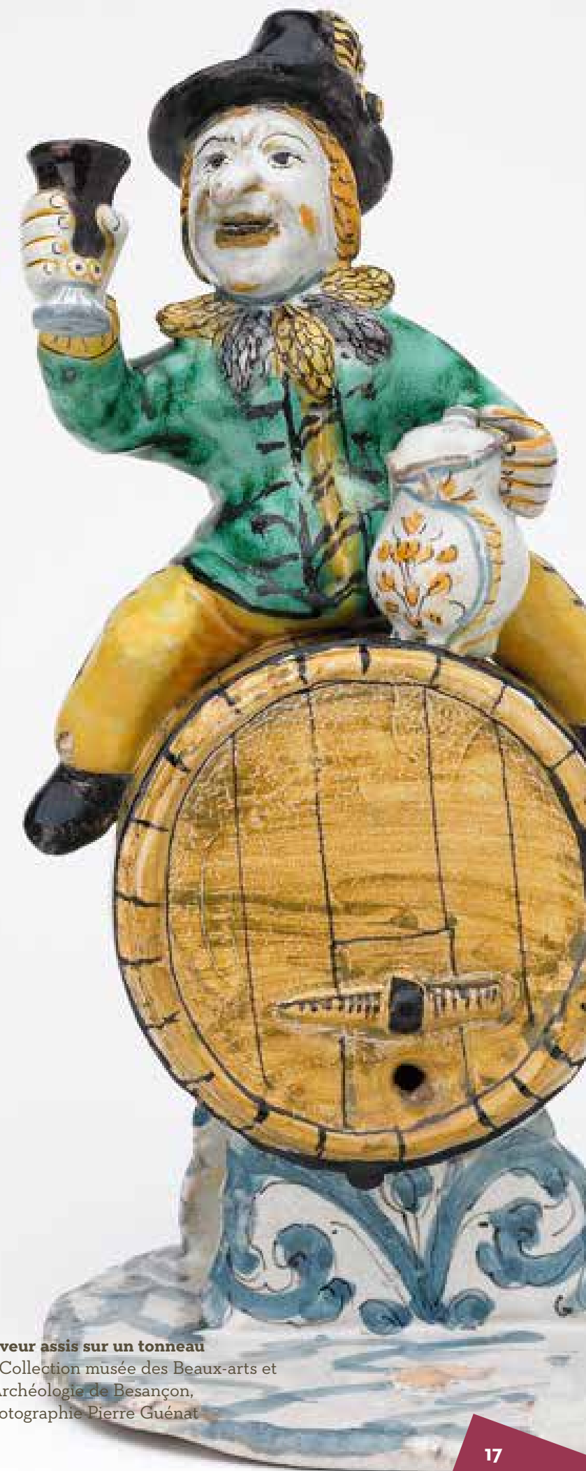
Buveur assis sur un tonneau