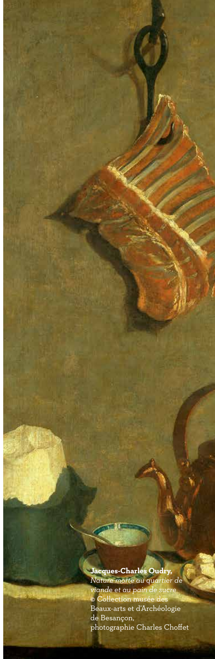
Jacques-Charles Oudry, Nature morte au quartier de viande et au pain de sucre

La nature morte joua un rôle important dans les révolutions artistiques de la fin du XIX ème siècle et fut un sujet affectionné par les artistes des avant-gardes du XX ème siècle.