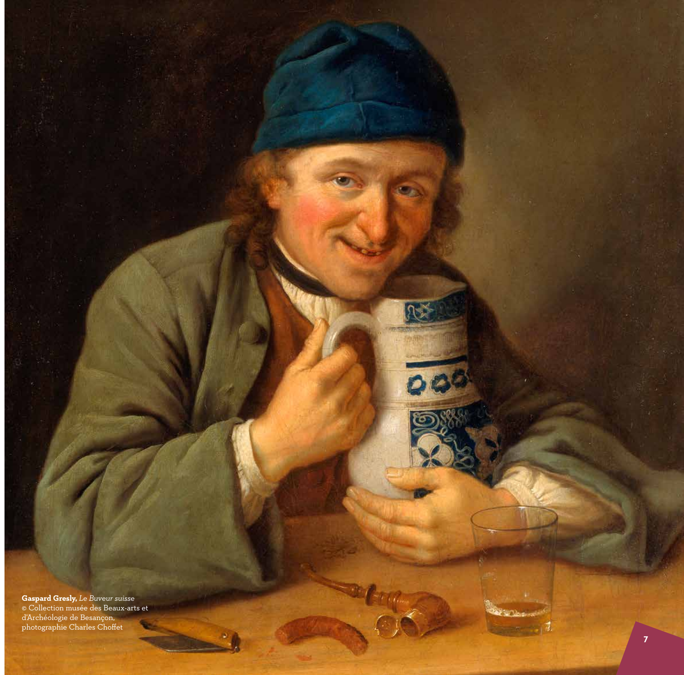
Gaspard Gresly, Le Buveur suisse © Collection musée des Beaux-arts et d'Archéologie de Besançon, photographie Charles Choffet

Enfin, les récipients à boisson et à boire ont donné lieu à de multiples créations dans des matériaux variés (verre, faïence, métal...), à mi-chemin entre plaisir de l'œil et plaisir du palais.