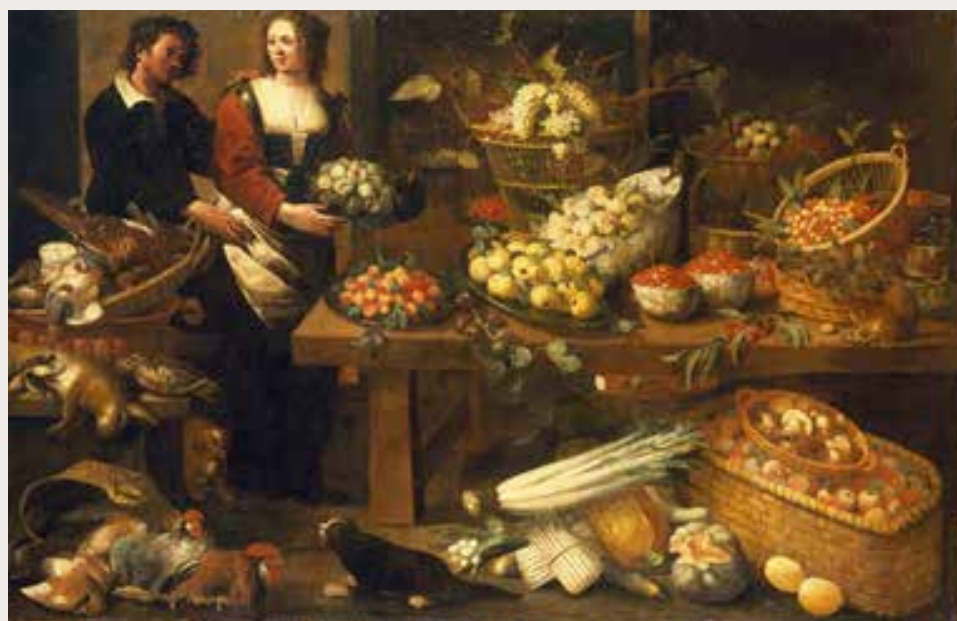
Pieter Van Boucle, Etable de fruits avec couple © Collection musée des Beaux-arts et d'Archéologie de Besançon, photographie Charles Choffet