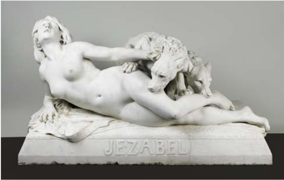
Léon-Auguste Perrey Jézabel , XIX ème siècle, collections du MBAA de Besançon