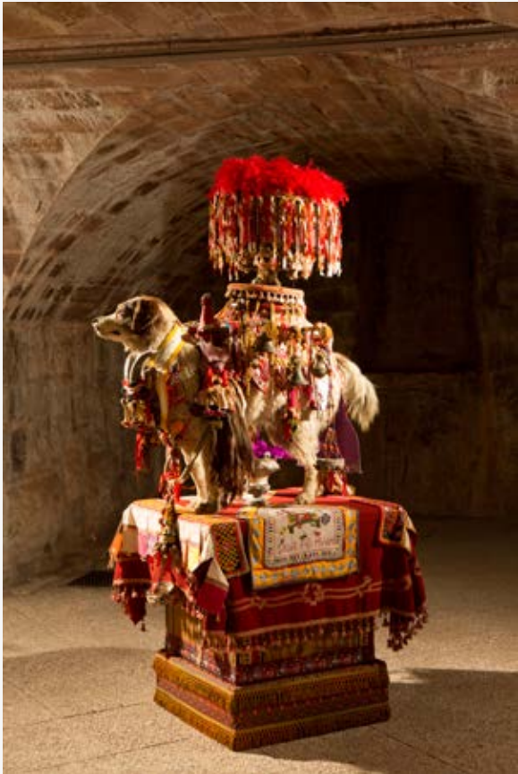
Benoit Huot , Chien, collection de l'artiste