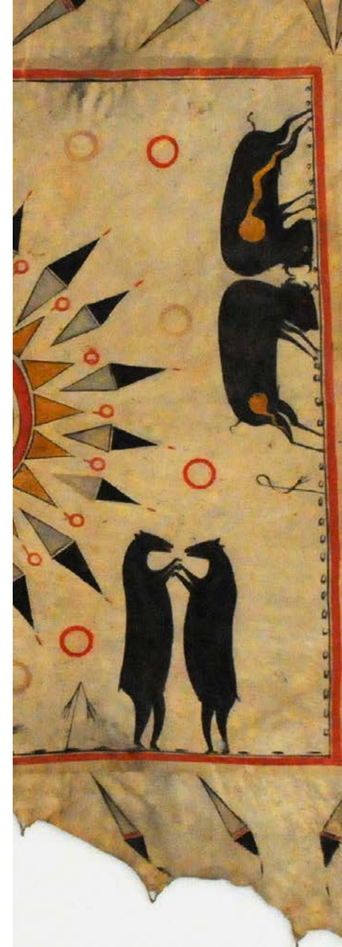
Cape au chasseur et aux animaux affrontés, Amérique du Nord, fin XVII e siècle

Grâce à ce travail en commun, Bêtes d'expo ! rapproche ainsi, le temps d'un été, art et science, observation et connaissance, pour que le public puisse se délecter tout en satisfaisant son inévitable curiosité pour les bêtes.