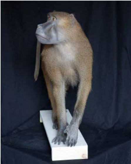
Babouin de Guinée , coll. du museum de la Citadelle. Photographie Yves Petit