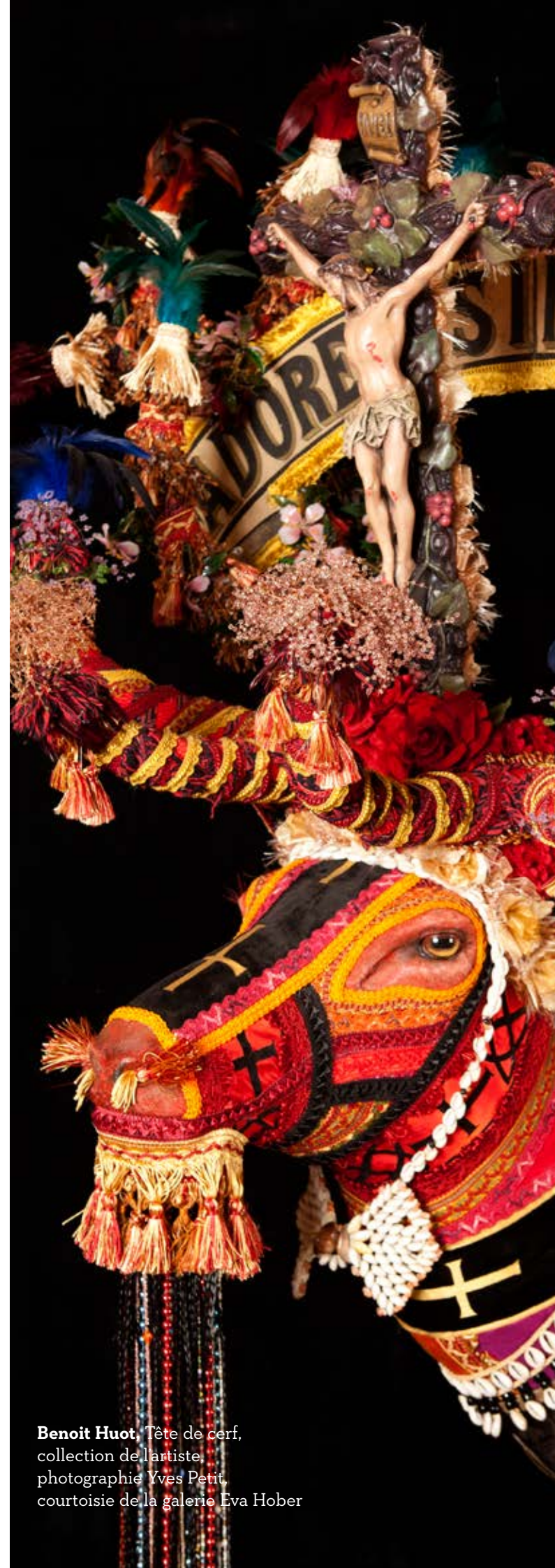
Benoît Huot , Tête de cerf, collection de l'artiste

Représenté par la galerie Eva Hober à Paris, l'artiste participera cet été à deux autres expositions collectives, à l'abbaye de Saint-Riquier (baie de Somme) et à la Halle Saint-Pierre à Paris.