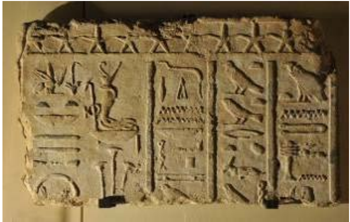
Bas-relief au nom d'Alexandre IV Aegos , Egypte.