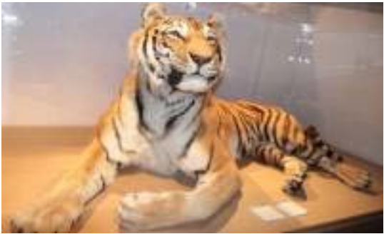
Le tigre Boris coll. du museum de la Citadelle