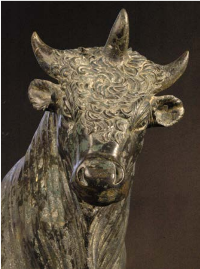
le taureau d'Avrigney , I er s. ap. J.-C. collections du MBAA de Besançon