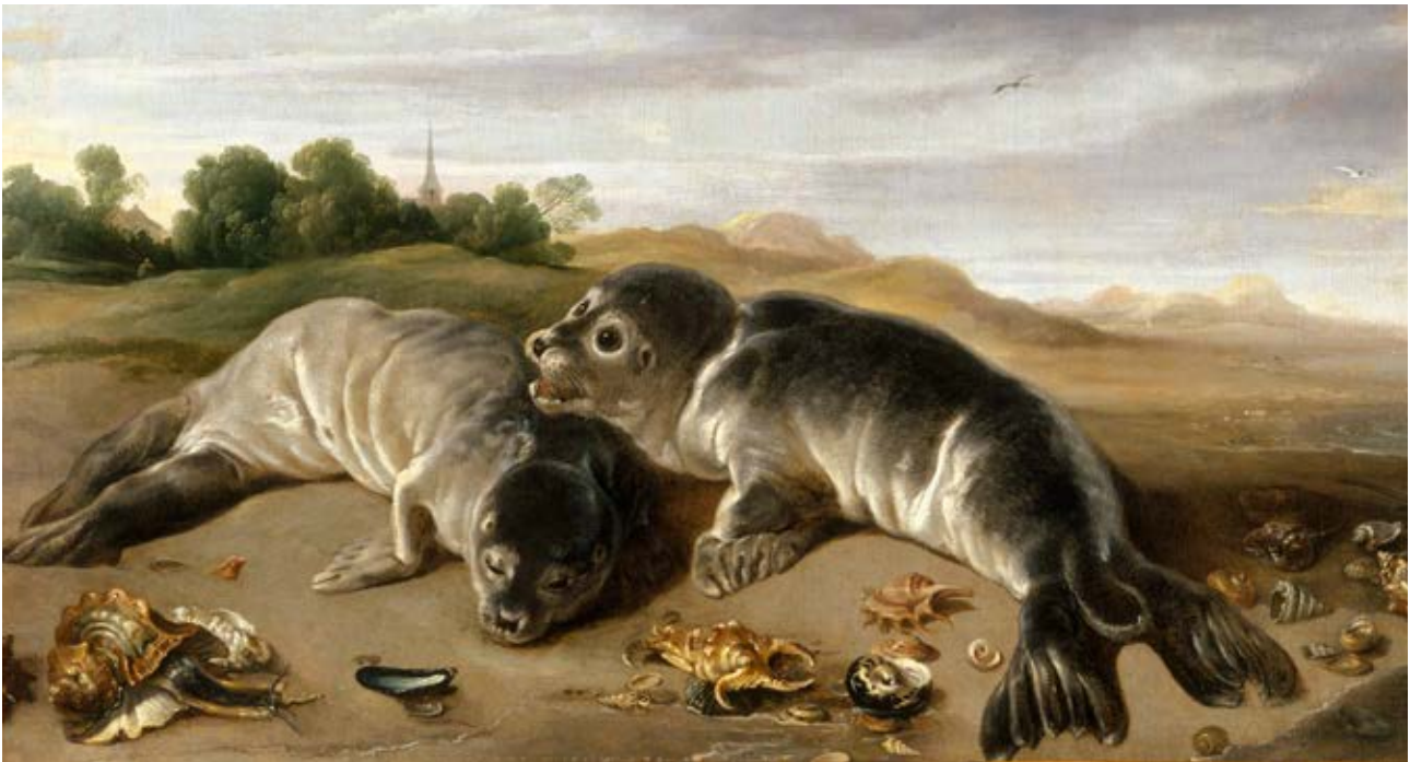
Paul de Vos , Deux jeunes phoques sur un rivage , XVII ème siècle collections du MBAA de Besançon.