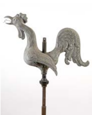
Coq de clocher , collections du musée comtois