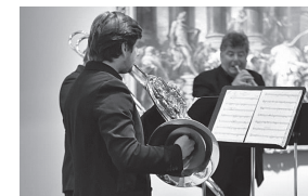
Surprise musicale par l'ensemble Tetraktys