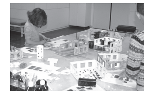
Atelier jeune public