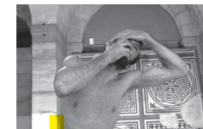
Déambulation de clôture Compagnie Astragale